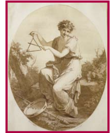
Angelika Kauffmann: L'Allegra, 1779. Radierung.