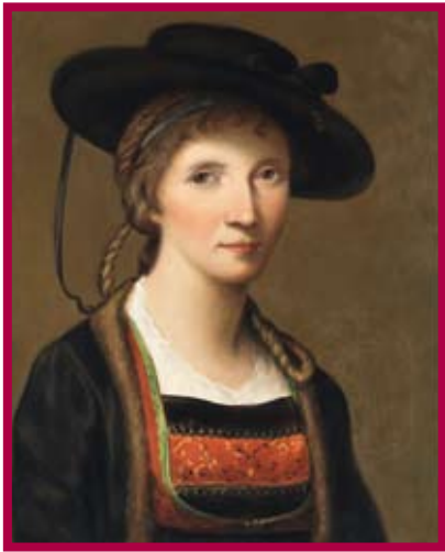
Alfons Bereuter: Selbstbildnis in der Tracht der Bregenzerwälderin. Kopie nach Angelika Kauffmann, 1991 (Original 1781). Öl auf Leinwand.